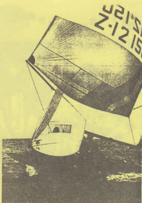
Munz / Enzler segeln zum Sieg in Vitrolles