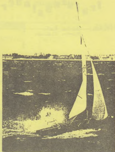
Dusche bei 8 Bft