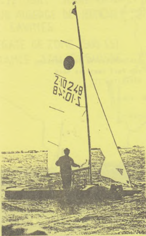
Max, häsch Problem??