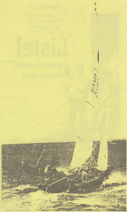
Delander / Höiman